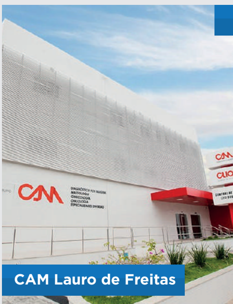
CAM Lauro de Freitas